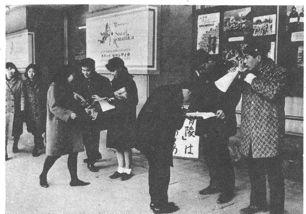
街頭での署名運動